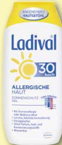
Ladival® Allergische Haut Sonnenschutz Gel LSF 30