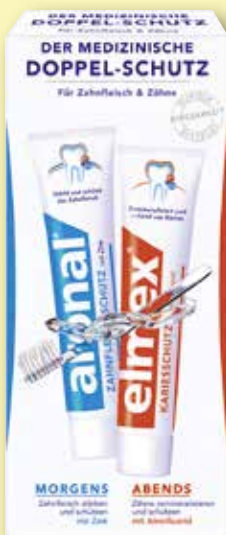
aronal® / elmex® Doppelschutz- zahnpasta