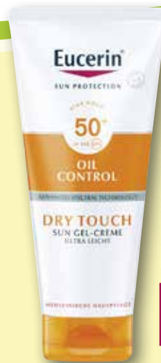
Eucerin® Oil Control Dry Touch Sun Gel-Creme Body LSF 50+