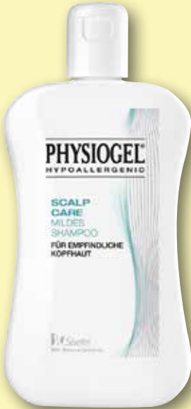
Physiogel® Scalp Care Mildes Shampoo